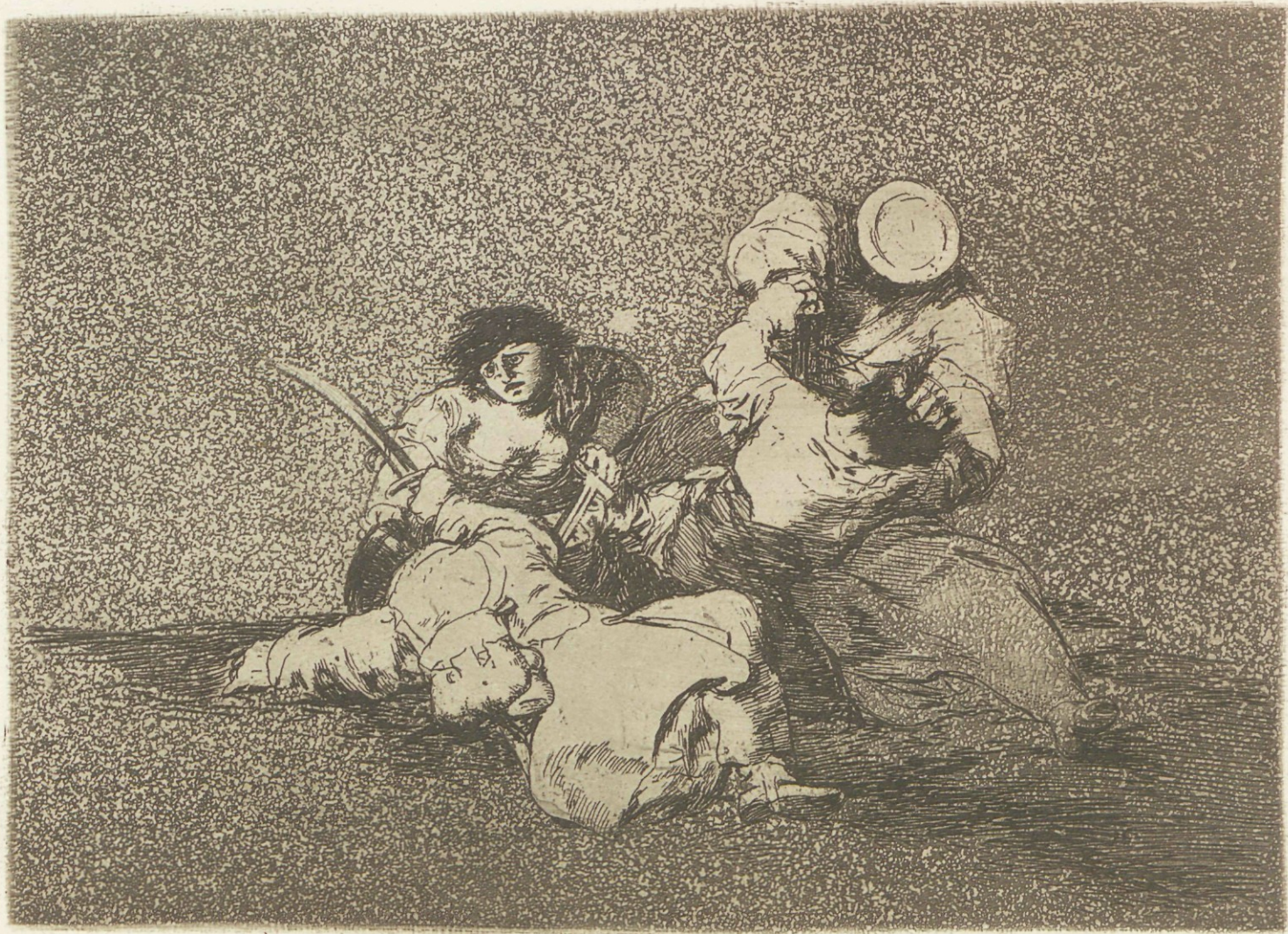
Las mugeres dan valor