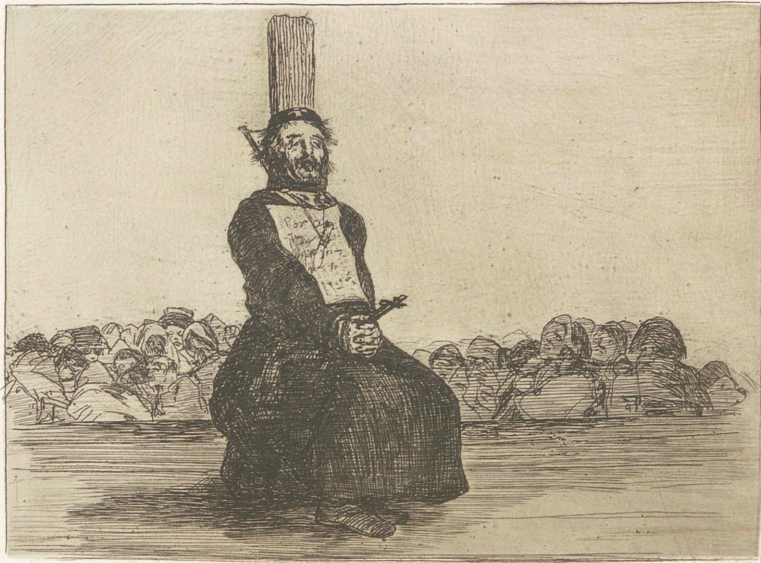
Por una navaja.