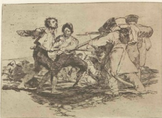
Los muertos de San Olaya.