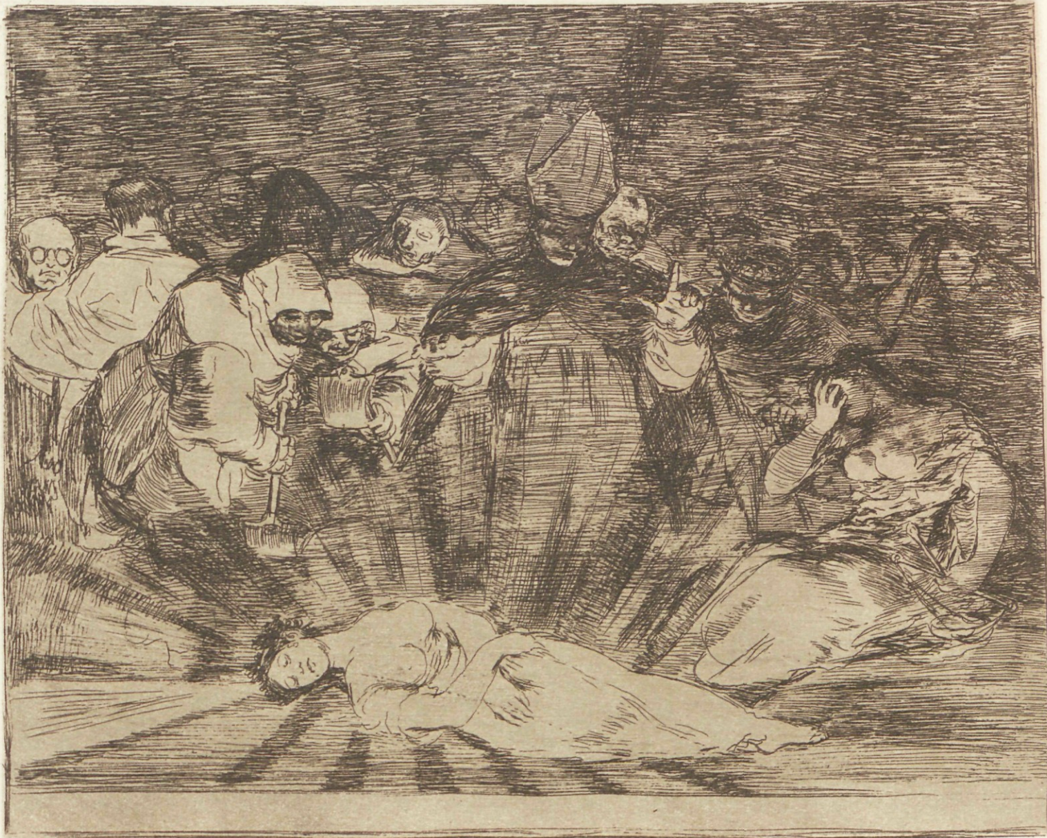
Murió la Verdad.