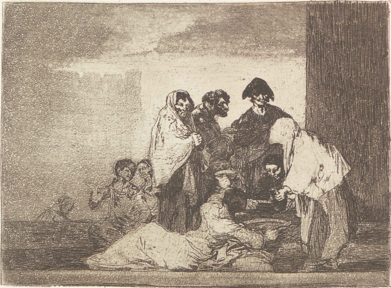
Gracias á la almorta.