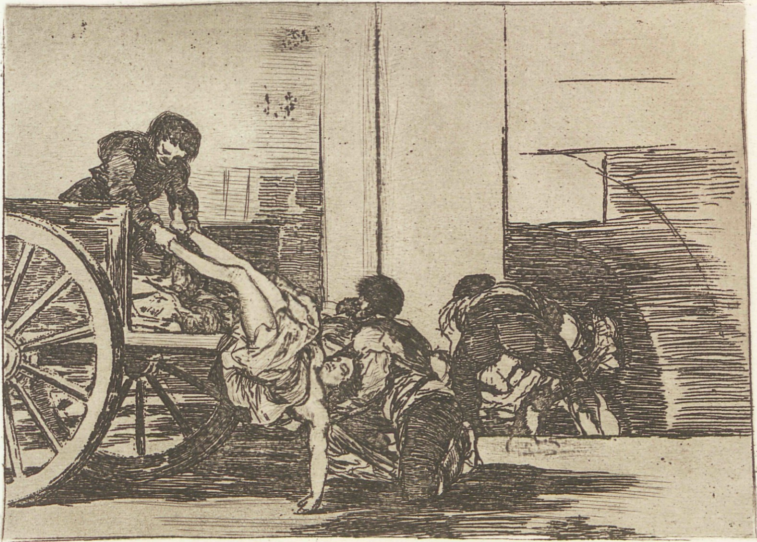
Carretadas al cementerio.