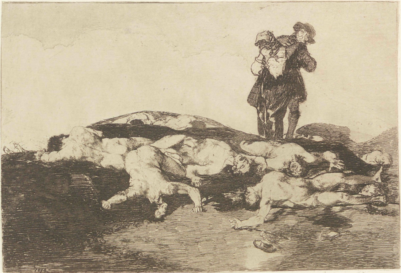
Enterrar y callar.