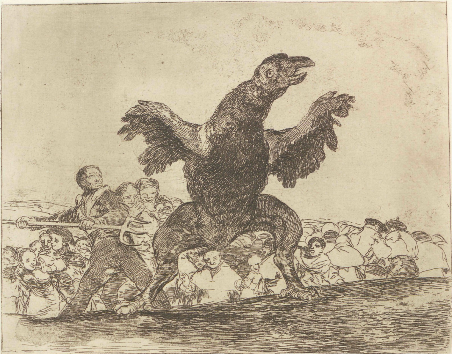
Et buitre carnivoro.