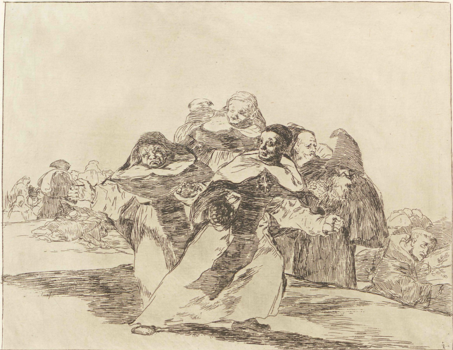
Fodo va revuelto.