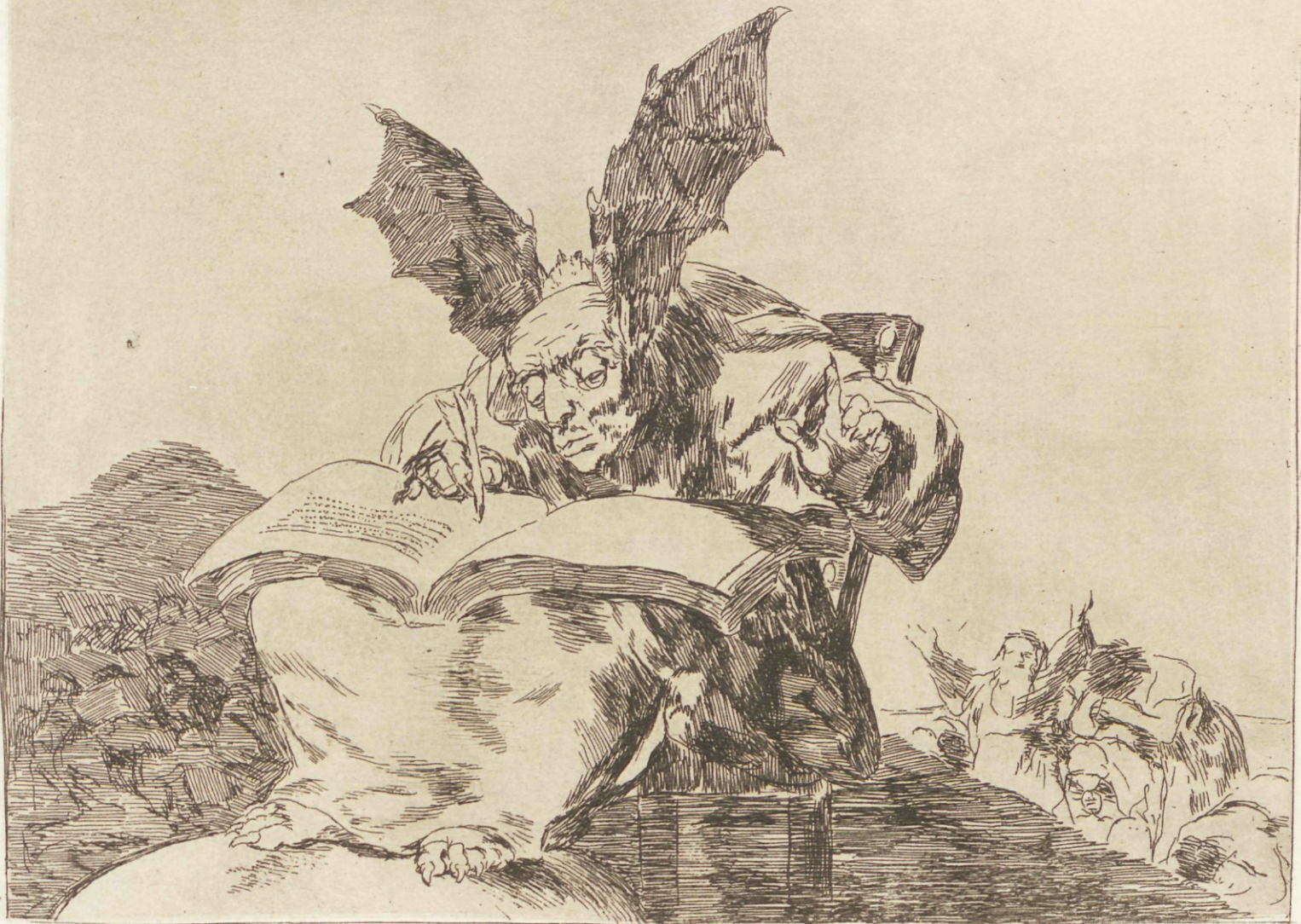
Contra el bien general.