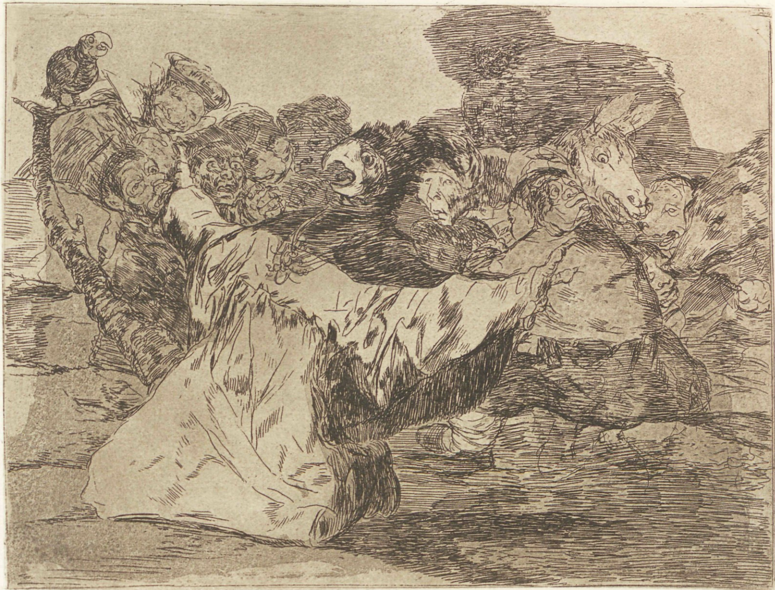
Farándula de charlatanes.