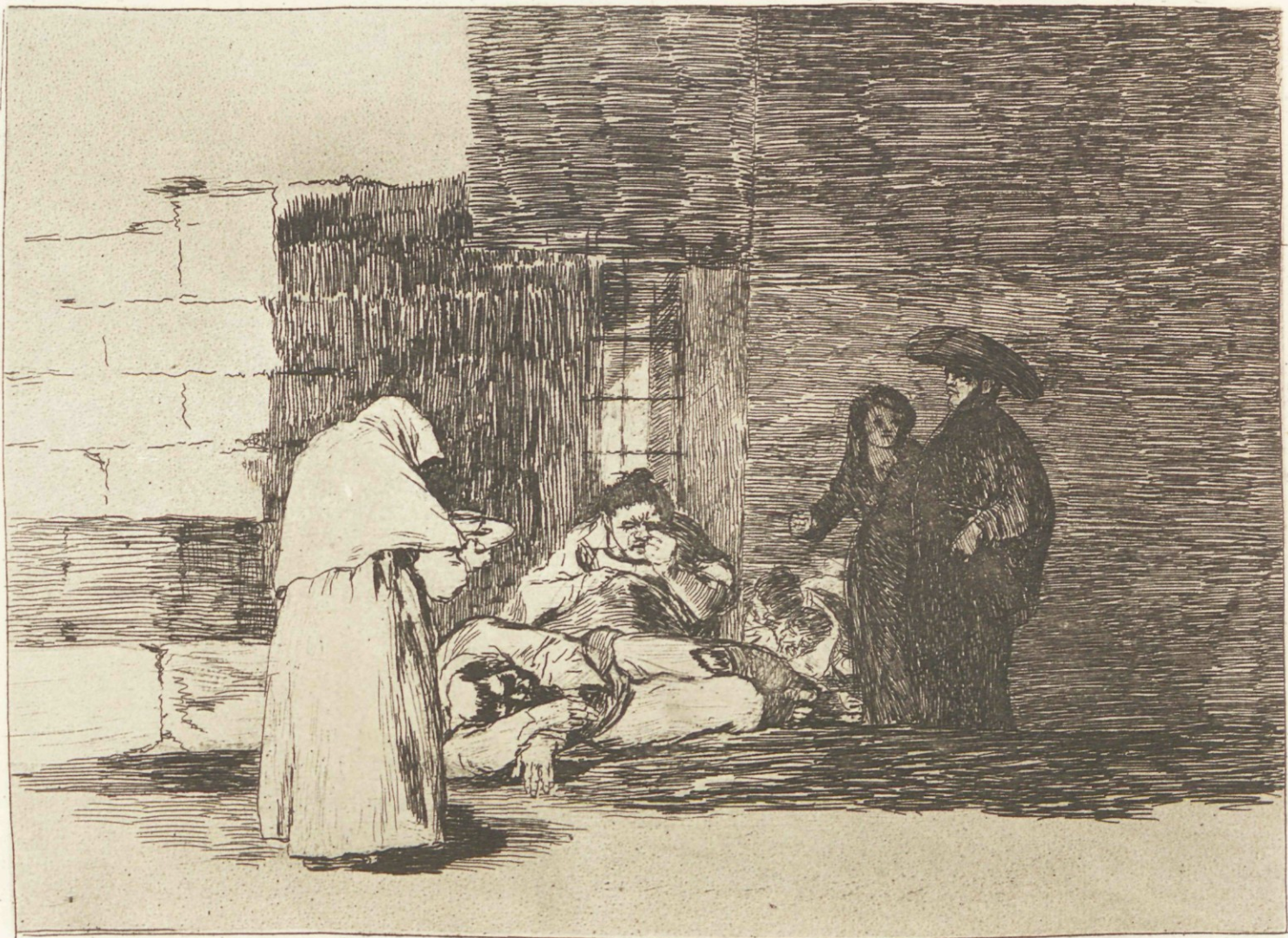
Caridad de una muger.