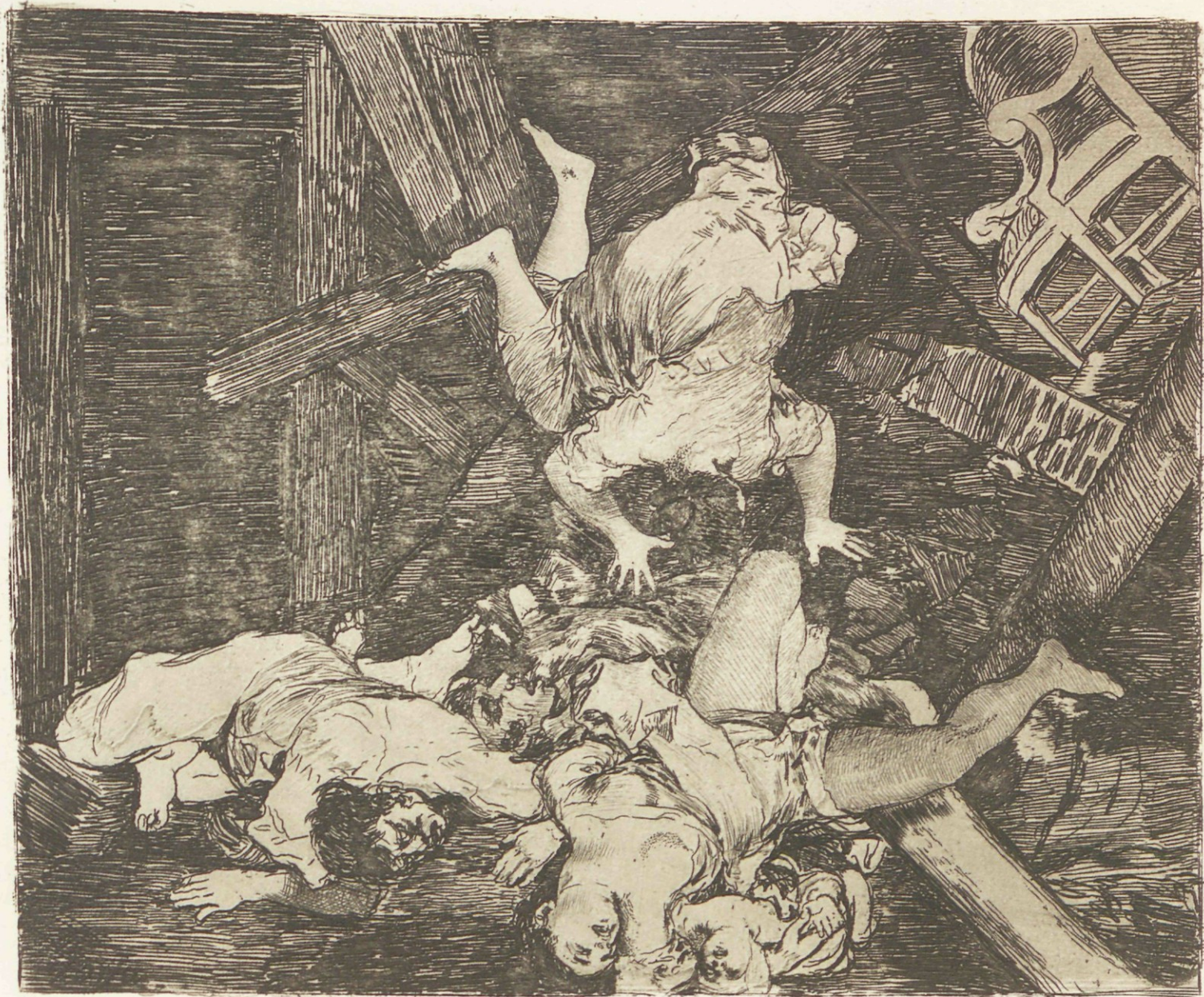
Estragos de la guerra