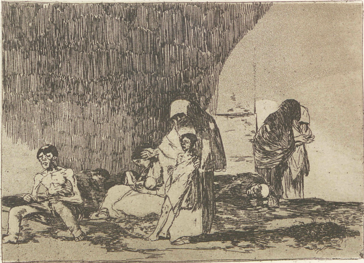
Sanos y enfermos.