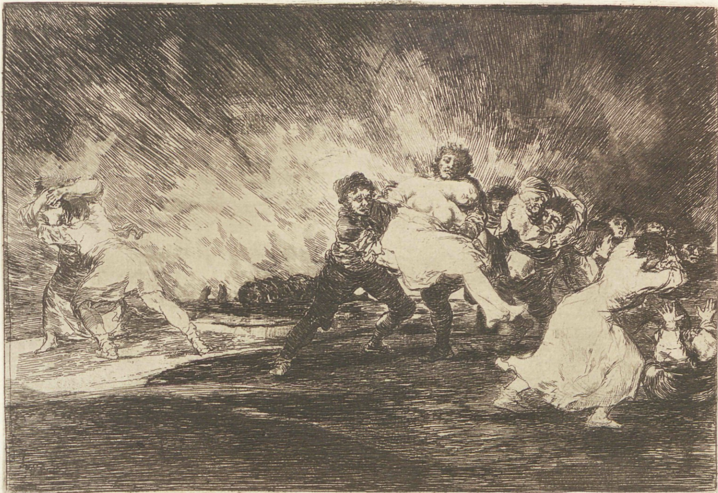
Escapan entre las llamas.