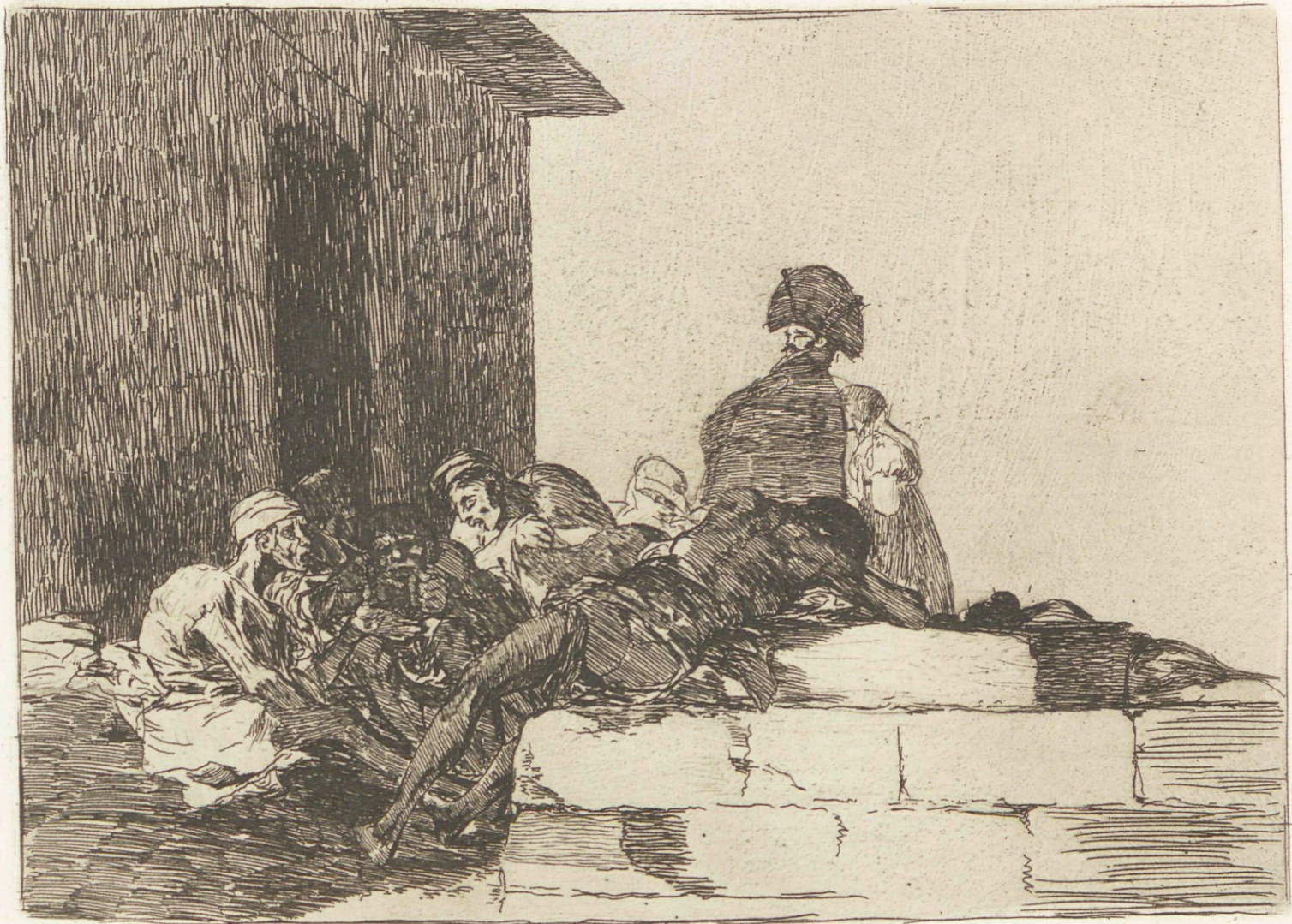
Clamores en vano.