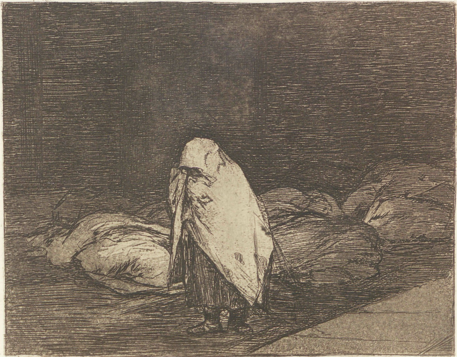
Las camas de la muerte.